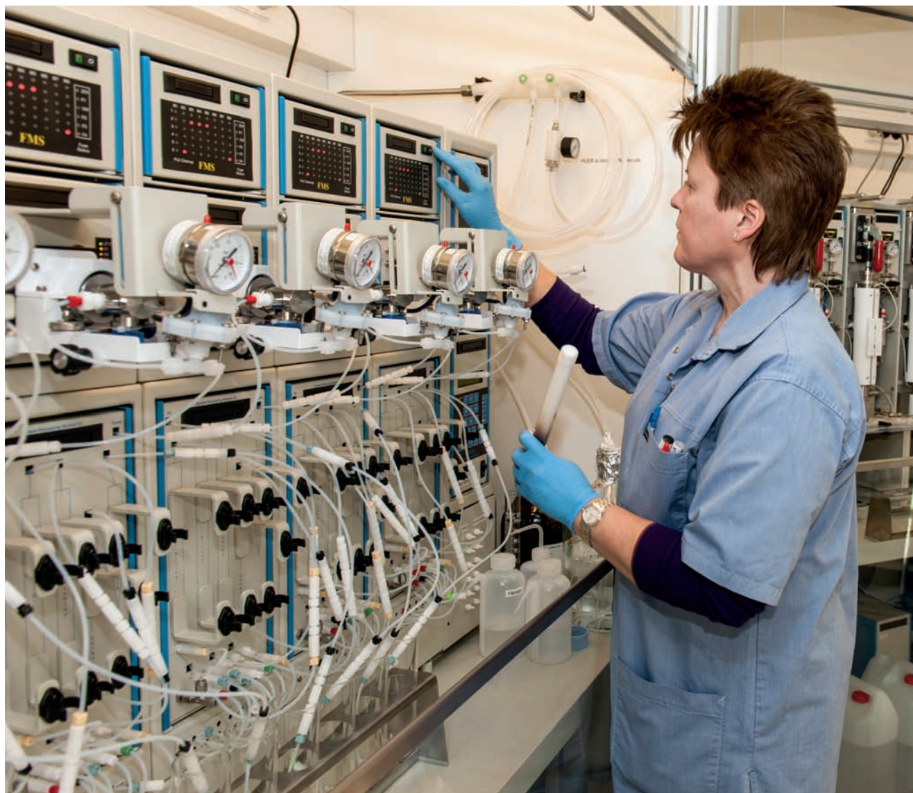
FF's laboratorium på højt specialiseret niveau er et betydende led i den ny kvalitetsafdeling.

givende samfunds krav til kvalitet er stærkt i fokus. Den har status som uafhængig stabsfunktion med sigte på både indkøb, egen produktion og i det hele taget kvalitet på alle niveauer fra fangst til forbruger.